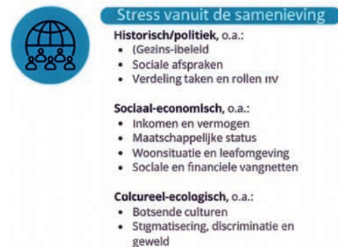
Figuur 1. Voorbeelden van contextuele stressbronnen